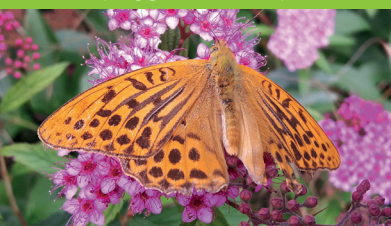
TABAC D'ESPAGNE ( Argynnis paphia )