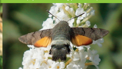
MORO-SPHINX ( Macroglossum stellatarum )