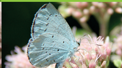
AZURÉ DES NERPRUNS ( Celastrina argiolus )