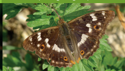
PETIT MARS CHANGEANT ( Apatura ilia )