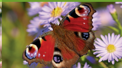
PAON-DU-JOUR ( Aglais io )