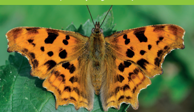
ROBERT-LE-DIABLE ( Polygonia c-album )