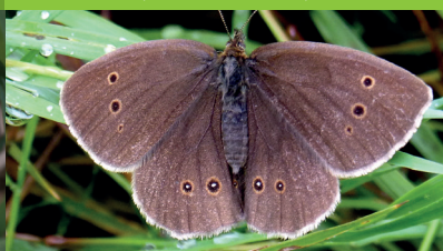
TRISTAN ( Aphantopus hyperantus )