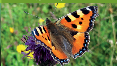
PETITE TORTUE ( Aglais urticae )