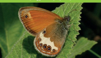
CÉPHALE ( Coenonympha arcania )