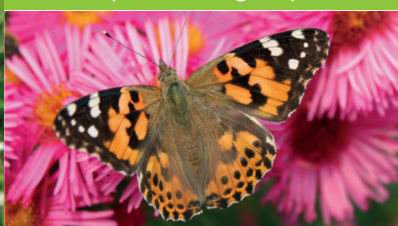
BELLE-DAME ( Vanessa cardui )