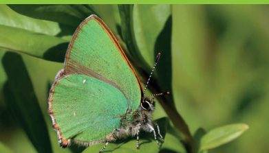
THÉCIA DE LA RONCE ( Callophrys rubi )