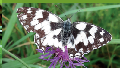
DEMI-DEUIL ( Melanargia galathea )