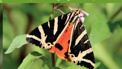
ÉCAILLE CHINÉE ( Euplagia quadripunctaria )