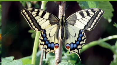
MACHAON ( Papilio machaon )