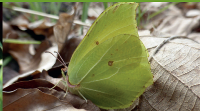
CITRON ( Gonepteryx rhamni )