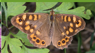
TIRCIS ( Pararge aegeria )