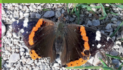
VULCAIN ( Vanessa atalanta )