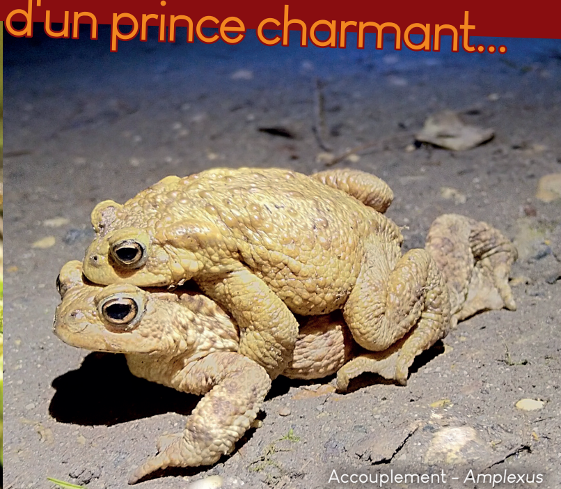
Accouplement - Amplexus